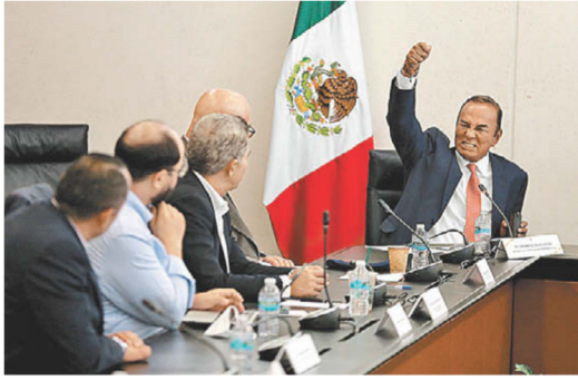
El político liberado saluda a legisladores. JAVIER RÍOS